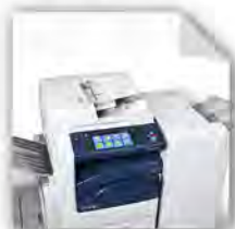
Drucker, Kopierer & Multifunktionssysteme