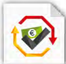
Kostenkontrolle & Authentifizierung