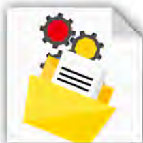
Digitale Archivierungs- und Scanlösungen