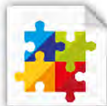
Gesamtkonzepte & Projektplanung

Carl-Benz-Straße 21 • 60386 Frankfurt am Main +49 69 / 94 102-0 • info@office-profis.de • www.office-profis.de