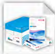
Papier, Toner & Verbrauchsmaterial